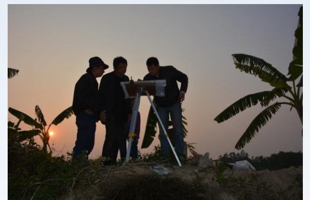
同城東漢墓群の共同調査 2013