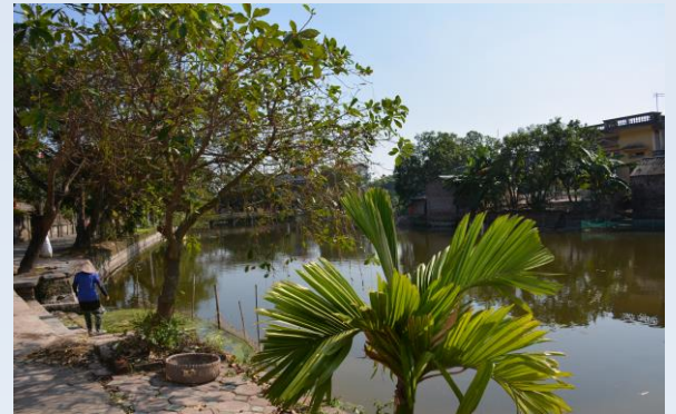
ベトナム LUY LAU 城・濠の東北角 2013