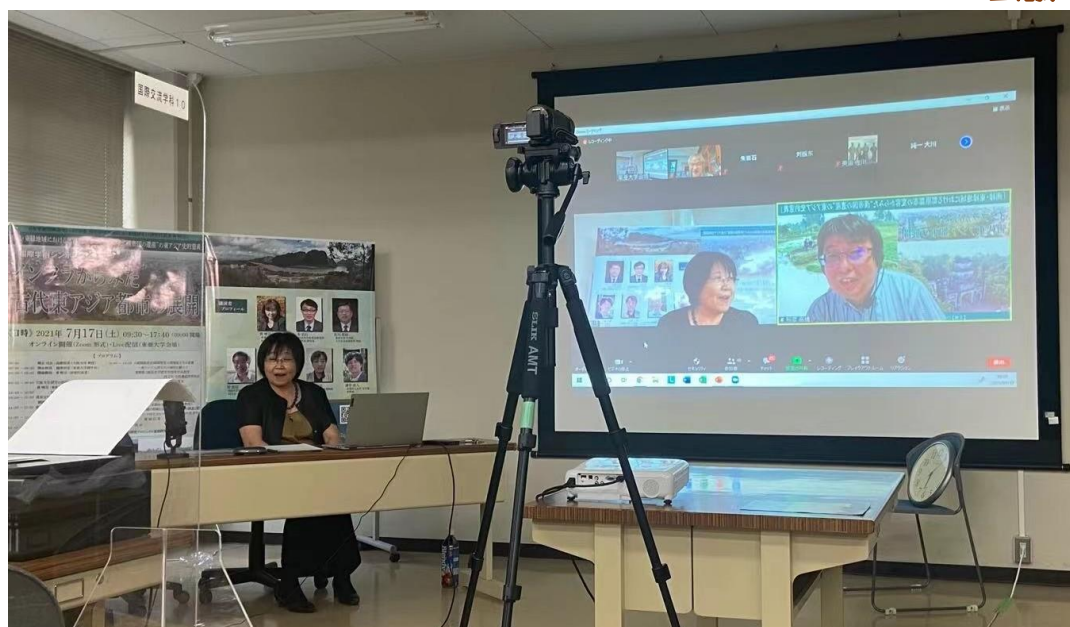
国際学術シンポジウム 開会