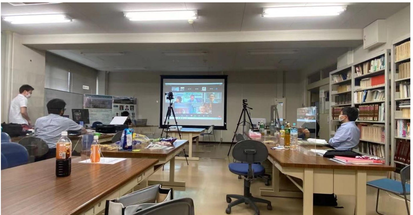
質疑応答・閉会 Live 配信

© 国際学術シンポジウムの事前登録者数合計 130 名, 当日の出席者数計 117 名 (視聴地域: 日・中・韓・米国・台湾)