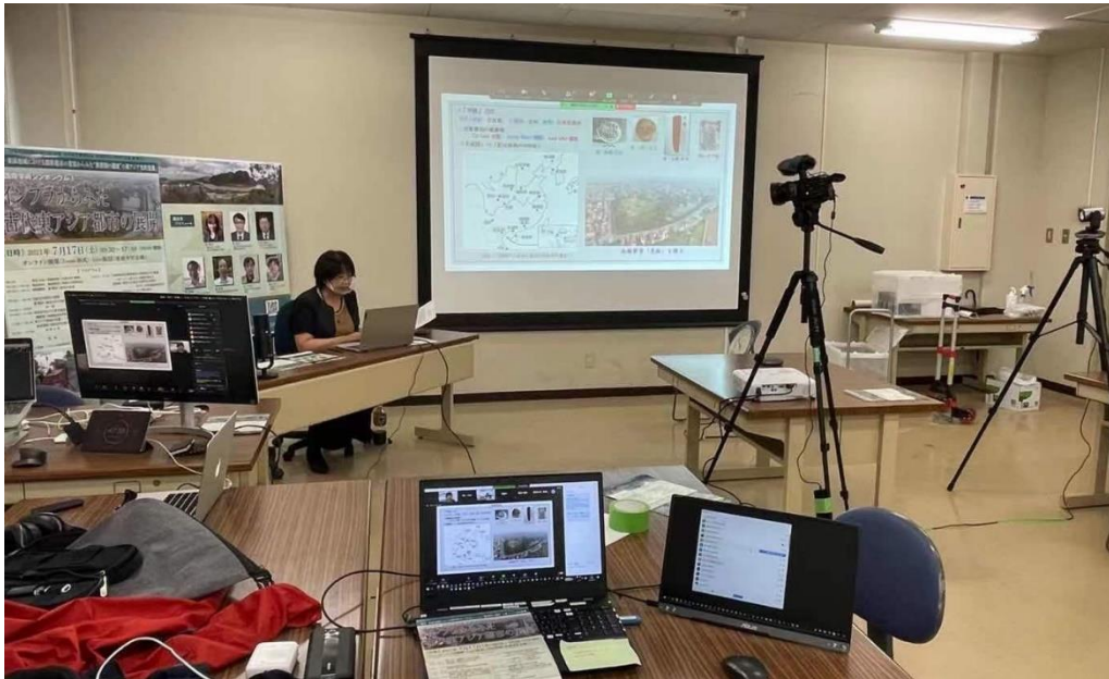
研究発表(東亜大学本会場) live 配信現場