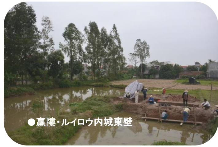
● 羸婁・ルイロウ内城東壁